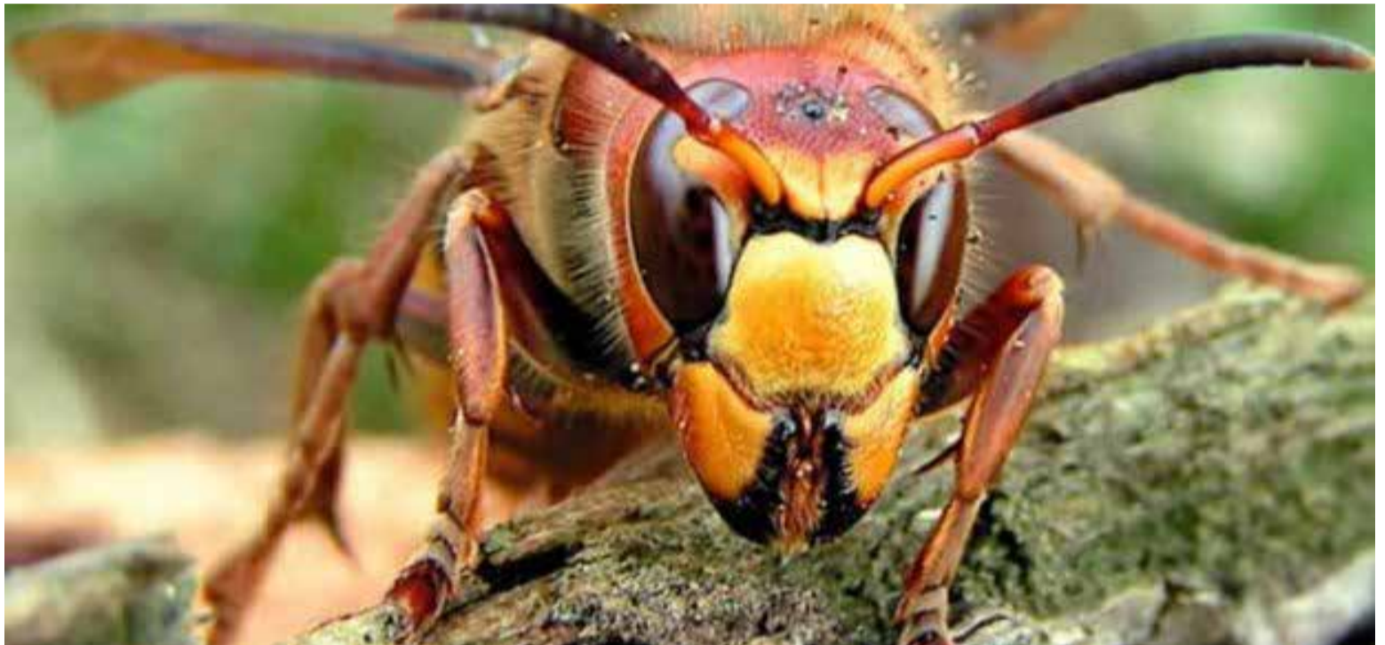
Temor hay por la posible presencia de «avispones asesinos» en Colombia. Las autoridades ambientales han tomado medidas preventivas.