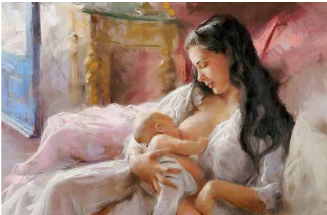
Solo una madre puede amar a una piraña, porque tu hijo será odiado por todos, menos por ti.

Y la llevó por un instante a una ciudad desconocida, donde una madre luchaba por la vida de su bebé. Podía escuchar que tenía varios meses transitando de un hospital a otro, que le decían que su hijo no tenía esperanzas. Pero ella peleaba como una guerrera, con una fe inquebrantable de que su hijo viviría. «Mira —le dijo Dios— este hijo