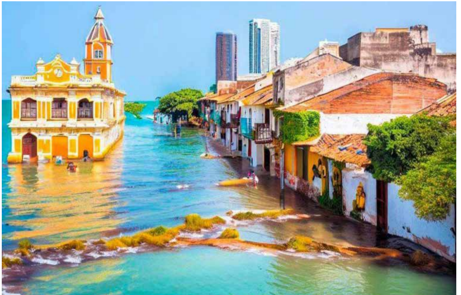
Estudio científico publicado por la prestigiosa revista Nature, la Cartagena del año 2100 estará en un hundimiento progresivo de muchos sectores de la ciudad, proceso que ya se activó hace décadas..

La primera alarma, agregó, se evidencia en el Hospital Naval de Cartagena, donde los pilares han comenzado a afectarse por cuenta de la subida de la marea. «Eso se llama el nivel freático, que se produce no solo