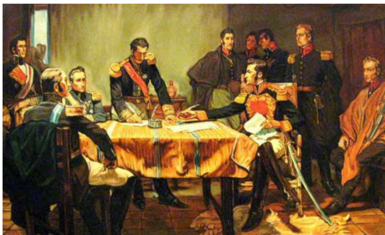
Héroes de la independencia

Para hacer justicia sobre la inquina y el despojo cometido, uno de los máximos exponentes y pensadores latinoamericanos, el cubano José Martí, cambió «por su cuenta» el nombre de América por el de