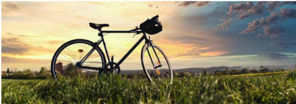
Preparado, salió por la carretera vehicular montado en su vieja bicicleta.

Cuando pudo se compró una bicicleta que pesa-