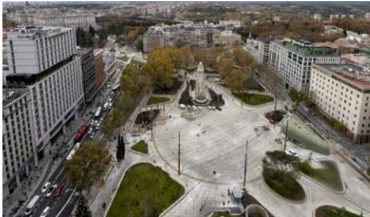
Nueva Plaza en el sector de la Gran Vía en Madrid