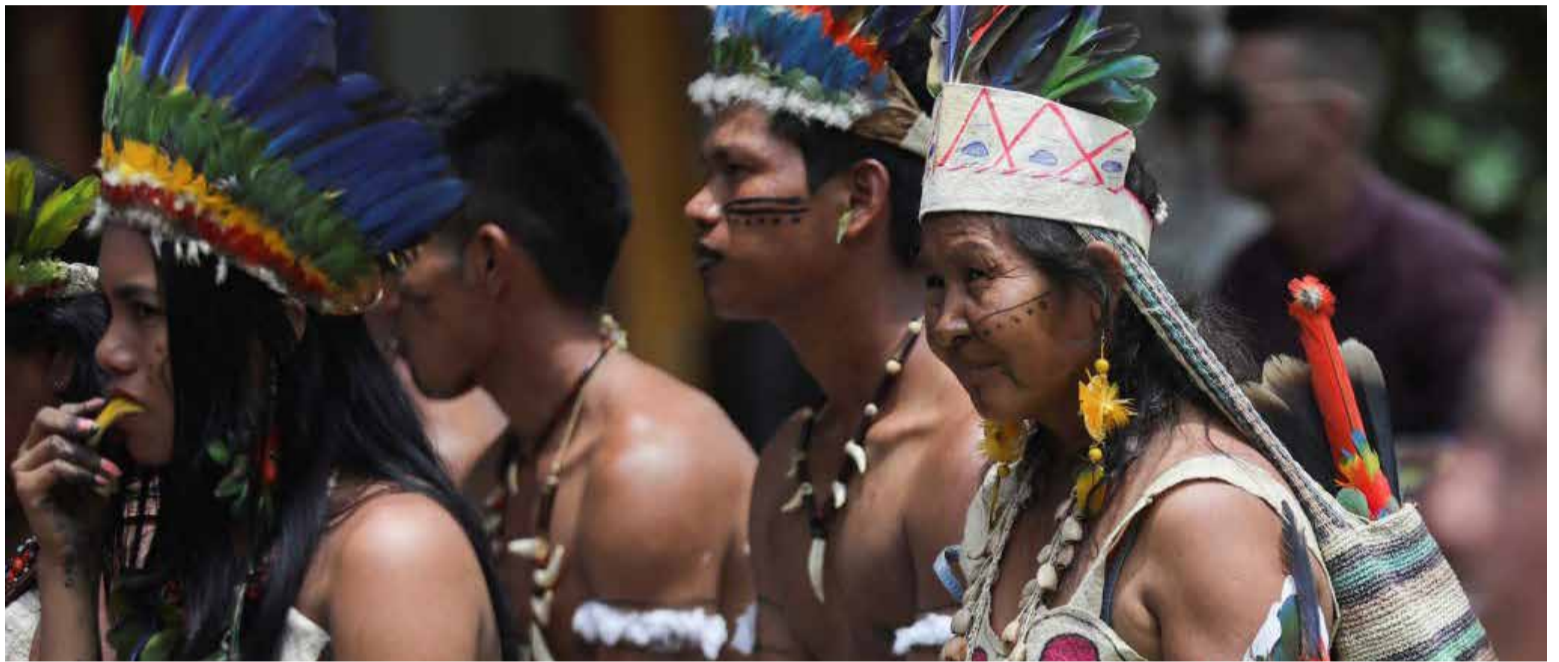
Existen 70 lenguas originarias habladas en Colombia por cerca de un millón de personas.

En el lenguaje de los aborígenes, guaraní significa guerra. Y este nombre fue aplicado por los españoles a los naturales agricultores que entre ellos se llamaban «ñe engatu o aba ñe e´» traducidos por habla del hombre y habla hermosa. En guaraní la piña o ananás es abacachí; el maíz, abati; jacaranda, árbol, que en Venezuela es pusana; y bucanero de origen guaraní; además, cahuín- mentira en Chile; carioca en Río de Janeiro, acutí y pécarí, roedor y jabalí, indistintamente. Los siglos han llevado a los estudiosos a intercalar en la lexicografía cas-