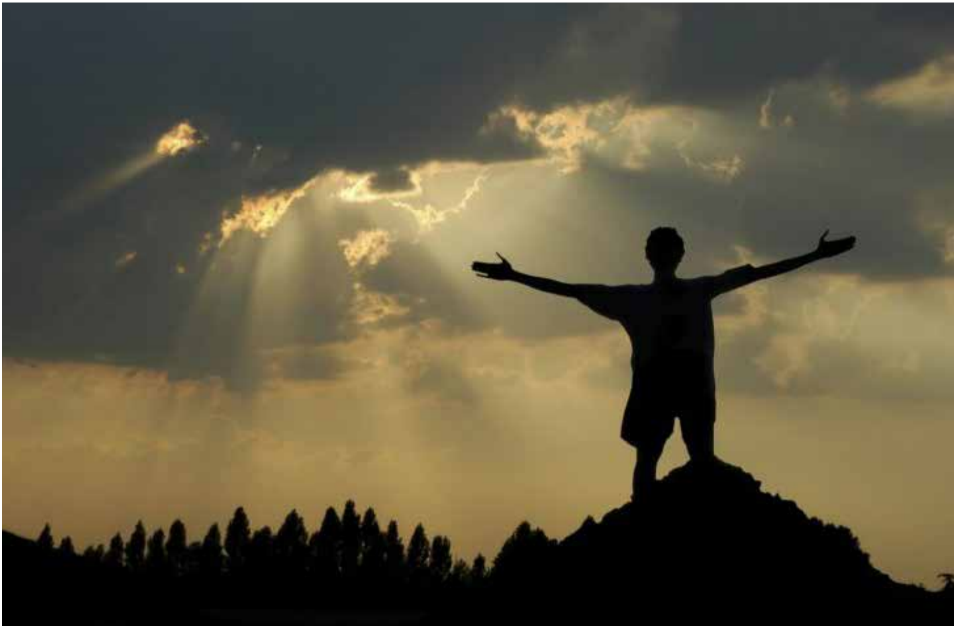
El éxito humano